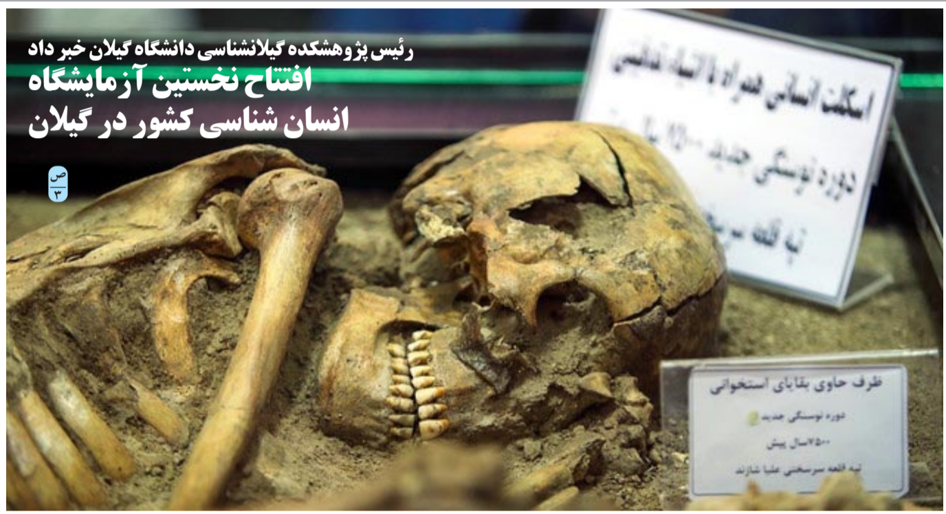
رئیس پژوهشگاه گیلانشناسی دانشگاه گیلان خبر داد افتتاح نخستین آزمایشگاه انسان شناسی کشور در گیلان