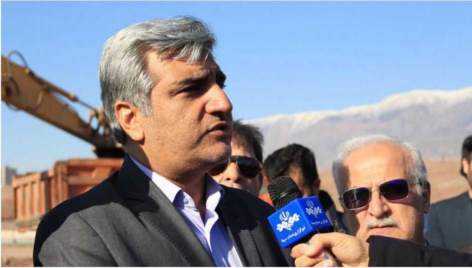
استاندار گیلان از انتقال ایستگاه عوارضی امامزاده هاشم به ورودی شهر لوشان خبر داد.