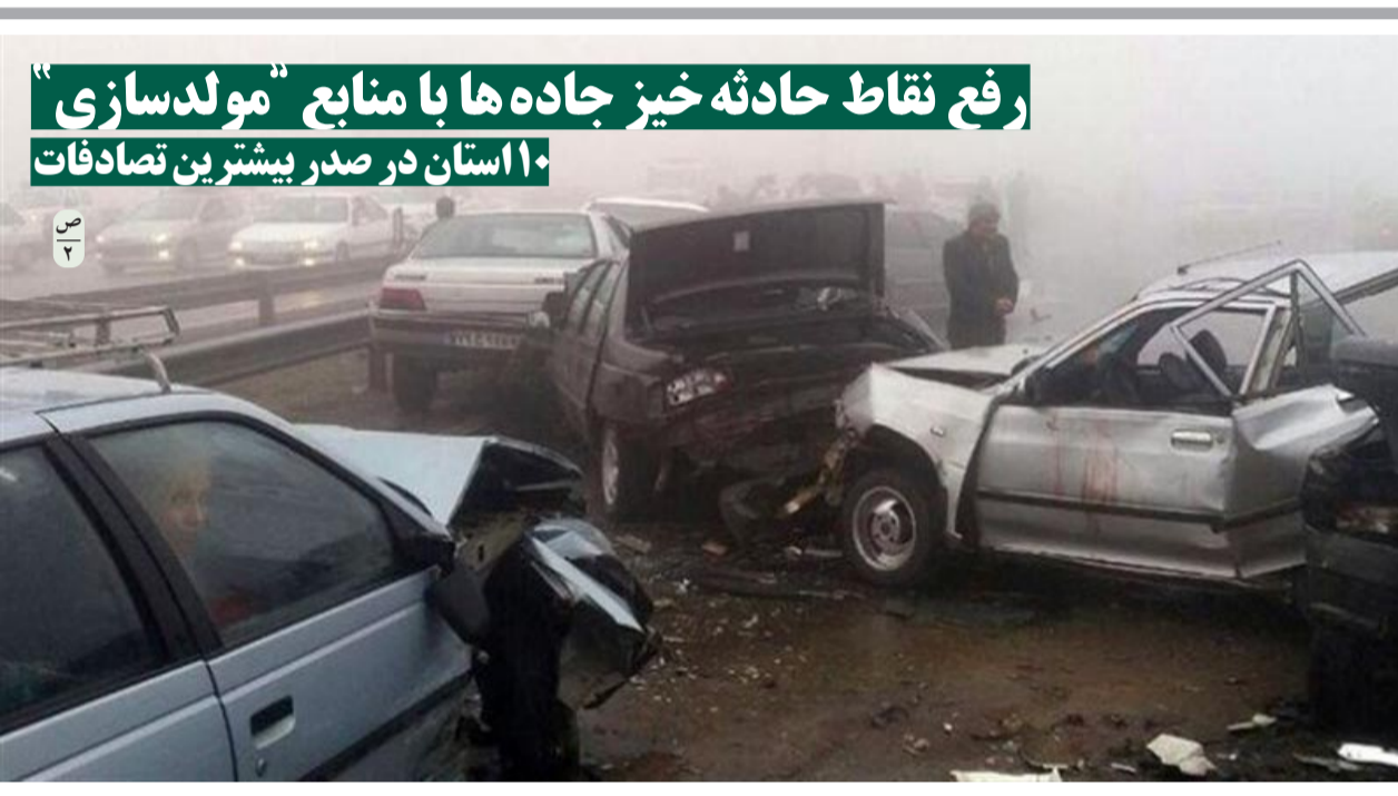
رفع نقاط حادثه خیز جاده‌ها با منابع "مولدسازی" ۱۰ استان در صدر بیشترین تصادفات