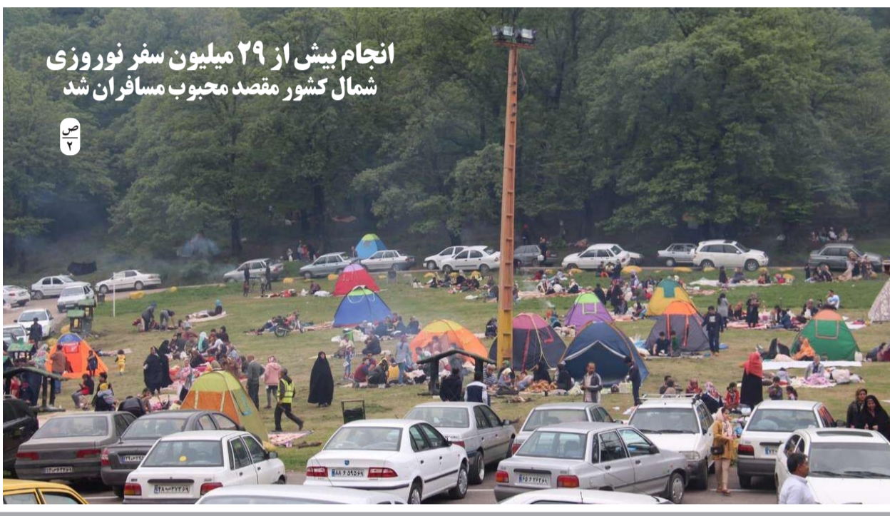
انجام بیش از ۲۹ میلیون سفر نوروزی شمال کشور مقصد محبوب مسافران شد

قالبیاف: اکنون وقت تصمیم گیری آمریکا برای جلب اعتماد ایران است